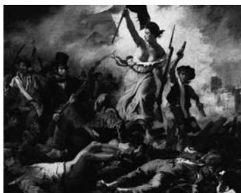
Eugene Delacroix Wolność wiodąca lud na barykady, 1830