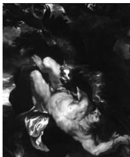
Pieter Paul Rubens Prometeusz , 1611–1612