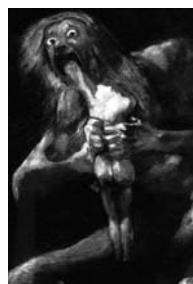
Francisco Goya y Lucientes Saturn pożerający swe dziecko, 1824

Dwaj wybitni artyści czasów romantyzmu wyrazili w swych obrazach silne emocje. Obaj sięgnęli przy tym do arsenału środków znanych dobrze literaturze. Jeden posłużył się alegorią, drugi – symbolem. Porównaj ze sobą obrazy. Spróbuj sklasyfikować ich tematykę. Zastanów się, dlaczego nie jest to łatwe. Czy dostrzegasz zbieżność ze współczesnymi poszukiwaniami w literaturze?